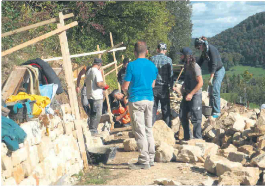
Freiwillige halfen 2017 und 2018 mit, in Wittnau eine Trockenmauer komplett neu aufzubauen.