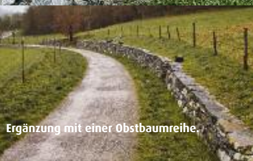
Ergänzung mit einer Obstbaumreihe.