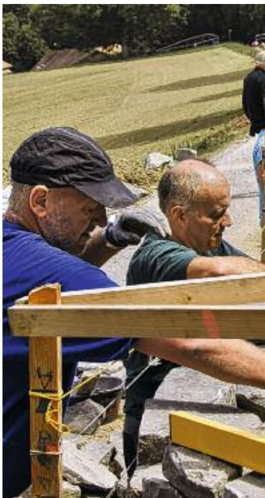
Anschauungsbeispiele für den korrekten Trockenmauerbau.

Die Gemeinde Ittigen hat von 2020 bis 2021 entlang des alten Bahntrassees des «Blauen Bähli», an der Wegverbindung Untereyfeld – Hinterer Schermen auf insgesamt 150 Laufmetern Trockenmauern angelegt. Die Arbeiten wurden in mehreren Etappen unter Anleitung und Aufsicht von erfahrenen Trockenmauerspezialisten und der freiwilligen Mitarbeit unterschiedlicher Gruppen wie beispielsweise Mitarbeitende der Gemeinde Ittigen, Schulklassen, Firmen, Quartiervereine, Naturschutzvereine etc. ausgeführt. Unterstützt wurden die Bauarbeiten durch die Farb AG, Köniz (Fachstelle für Arbeitsintegration Region Bern) und weitere lokal verankerte Unternehmen. Auch der Fonds Landschaft Schweiz FLS unterstützte den Bau der Trockenmauern finanziell.