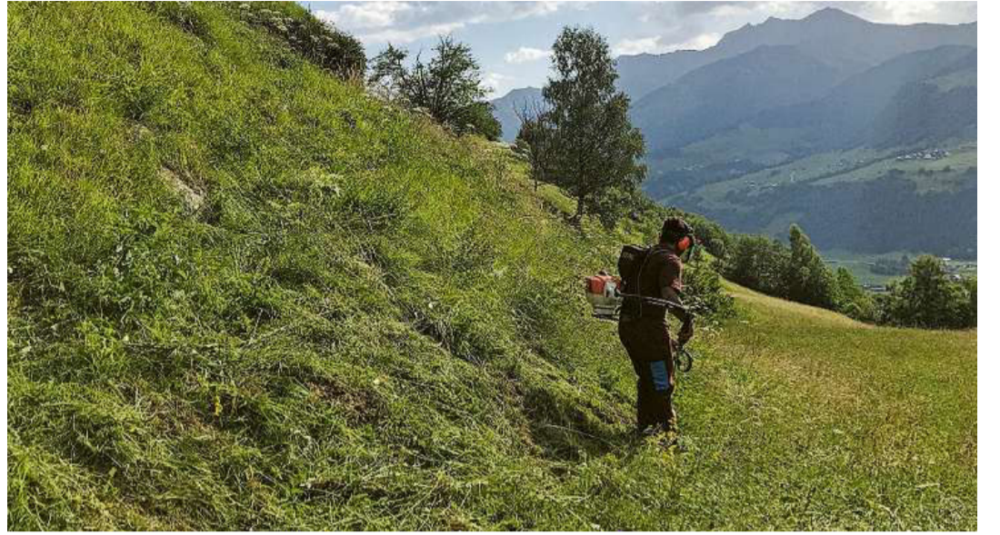
En acciun a Valleses sut Vignogn. In gi da steppadad.