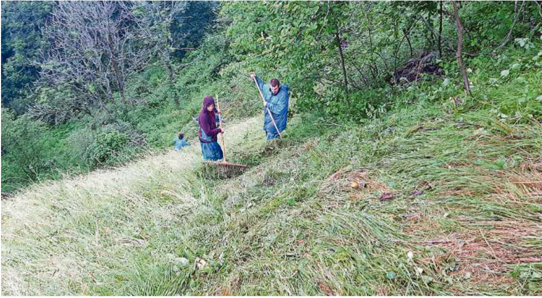
Ella plaunca tessaglia encounter la Val Trutgs.