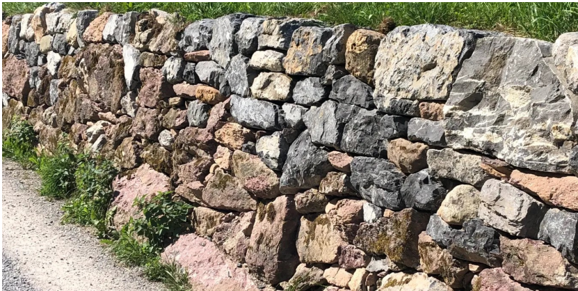
Neu sanierte Trockenmauer, Steingefüge mit Öffnungen für kleine Tiere und Pflanzen. - Gemeinde Glarus

Wie die Gemeinde Glarus mitteilt, werden die Arbeiten an den Trockenmauern zur Förderung der Biodiversität im Frühling 2023 fortgesetzt.