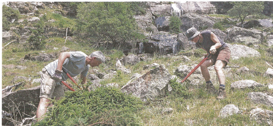
Certains participants ont aussi effectué du débroussaillage, comme ici au val Carma (GR).

ÉCOLOGIE Pro Natura et la Fondation Actions Environnement organisent depuis 30 ans des vacances en faveur de l'environnement. Malgré la crise, 13 semaines pour la nature sur 20 ont pu avoir lieu en 2020. Les participants ont accompli