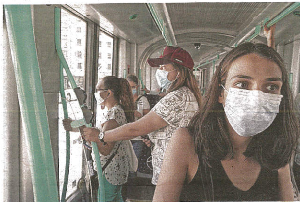
L'obligation, en vigueur dans les transports depuis juillet, va durer.

Les masques devraient nous accompagner pendant encore un certain temps, selon l'Office fédéral de la santé publique (OFSP). Dans une lettre envoyée aux cantons, il évoque le prolongement du port du masque afin d'éviter... une quatrième vague, rapporte le «Tages-Anzeiger». Raison invoquée: les personnes refusant d'être vaccinées pourraient provoquer de nouvelles infections même après la campagne d'immunisation. L'information fait réagir sous la Coupole fédérale. Beat Walti, président du groupe PLR, pense que chaque personne a le droit de ne pas se faire vacciner. Mais