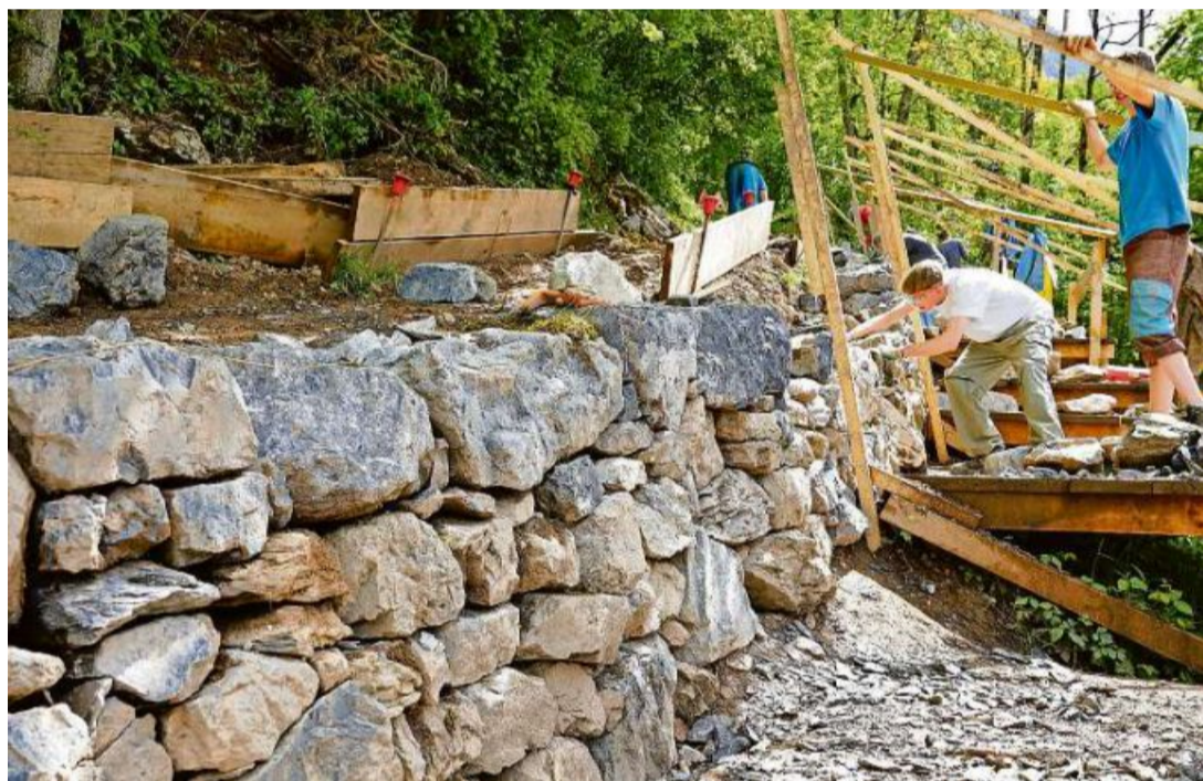
Knochenarbeit: Drei junge Zivildienstleistende platzieren von Hand und mittels Hebelwirkung schwere Steine an den richtigen Platz – ein Teil der Trockensteinmauer ist bereits fertig erstellt, trotz des teils garstigen Maiwetters.