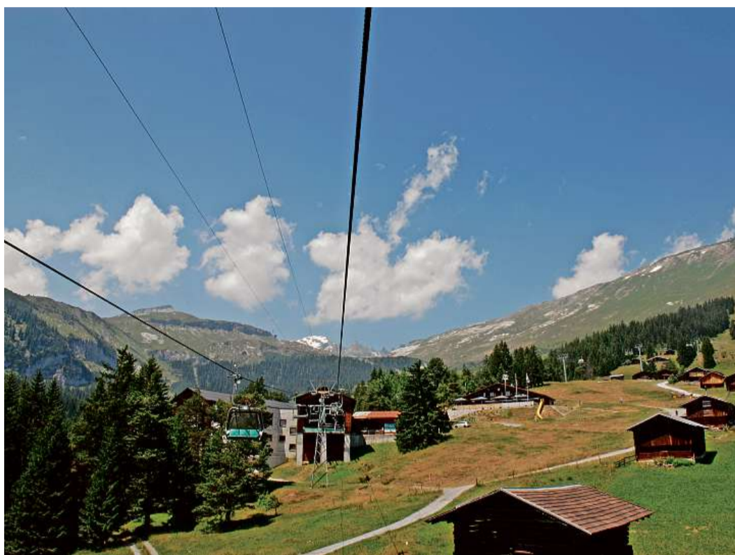
In avantatg per Flem: La pendiculara nova sefermass era a Foppa.