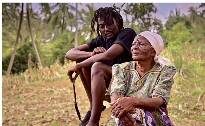
Igls 30avels «Gis digl film mundial» da Tusàn àn liac en egn rom redutgieu.