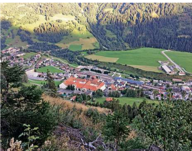
Dumengia proxima elegia Mustér ses gremis politics.